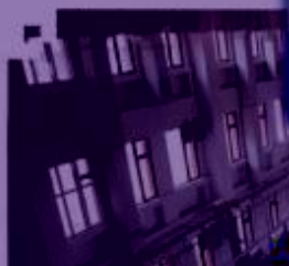
100% 校企技术 深度融合