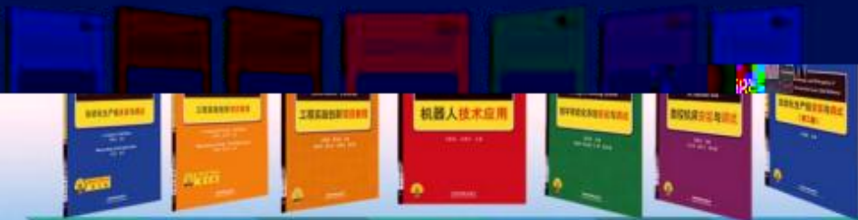
一体化课程教学设计 综合式课堂